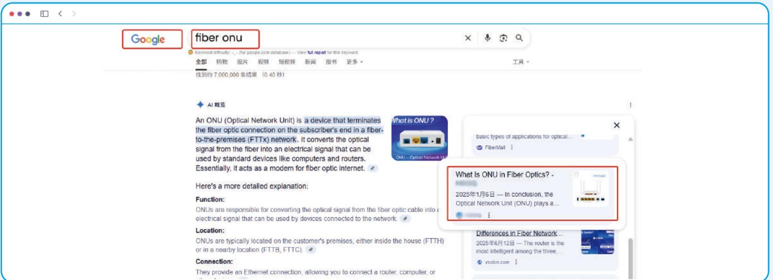
谷歌(Google)中搜索“纤维onu”（光纤网络单元）人工智能推荐客户的品牌